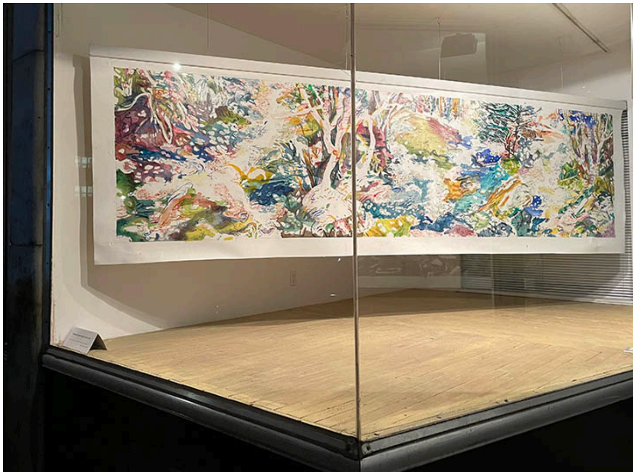
Susan G. Scott

Employing a variety of critical perspectives, these two practices reflect a desire to look and look again, the status of the image, exploring landscape as a place to explore the landscape as a place where new traces are imbued.